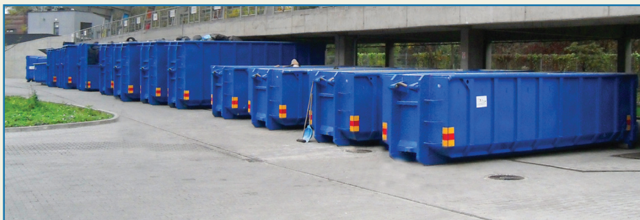
Punkt selektywnej zbiórki odpadów komunalnych - PSZOK

Dodatkowo część odpadów problemowych takich jak przeterminowane leki, zużyte baterie i akumulatory będzie można także przekazać do punktów zbiórki tych odpadów. I tak leki będzie można zostawić w specjalnych pojemnikach usytuowanych w wybranych aptekach, a zużyte baterie i akumulatory będzie można zostawić w pojemnikach ustawionych w dużych sklepach, szkołach czy instytucjach.