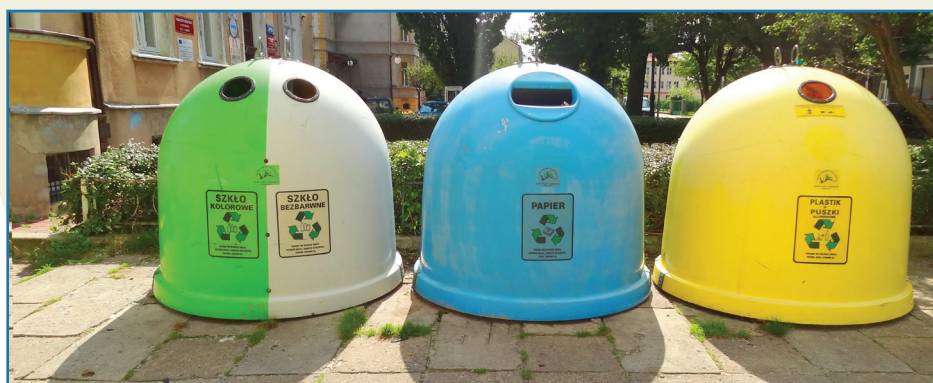
Pojemniki IGLOO do selektywnej zbiórki odpadów przy ul. Piłsudskiego w Dębnie

Przed włożeniem segregowanych śmieci do worka lub pojemnika igloo należy zgnieść opakowania plastikowe i wielomateriałowe, by zajmowały jak najmniej miejsca oraz odkręcić od opakowań szklanych wszystkie zakrętki, pokrywy i przykrywy. Odpady należy także opróżnić z resztek produktu lub jedzenia.