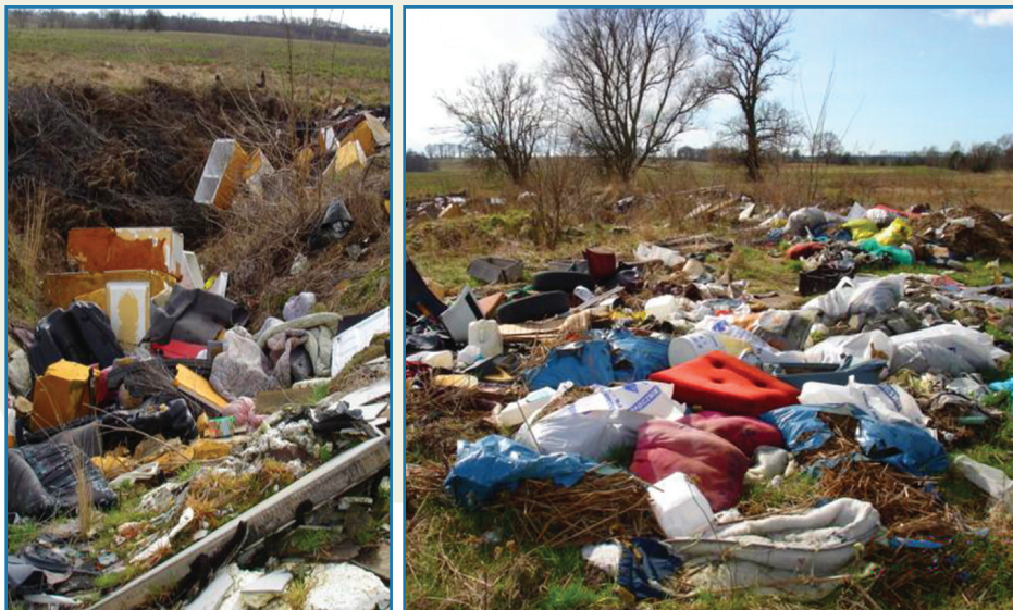
Nielegalne „DZIKIE” wysypiska odpadów w okolicach Dębna

Znowelizowana ustawa o utrzymaniu czystości i porządku w gminach wprowadziła rewolucję w organizacji gospodarki śmieciowej w całym kraju. Nowe zapisy ustawy mają na celu dostosować gospodarkę odpadami komunalnymi do wymogów Unii Europejskiej. Wszystkie zmiany w zakresie odbioru odpadów komunalnych mają sprawić, że nikomu nie będzie opłacało się wyrzucać śmieci i tworzyć dzikie wysypiska, bo wszyscy mieszkańcy będą objęci systemem zbierania odpadów. Głównym celem wprowadzanych zmian jest zwiększenie poziomów recyklingu i odzysku odpadów zbieranych selektywnie oraz zmniejszenie masy odpadów biodegradowalnych kierowanych do składowania. Pamiętajmy, że śmieci to cenny surowiec, który powinniśmy w miarę możliwości ponownie wykorzystywać.